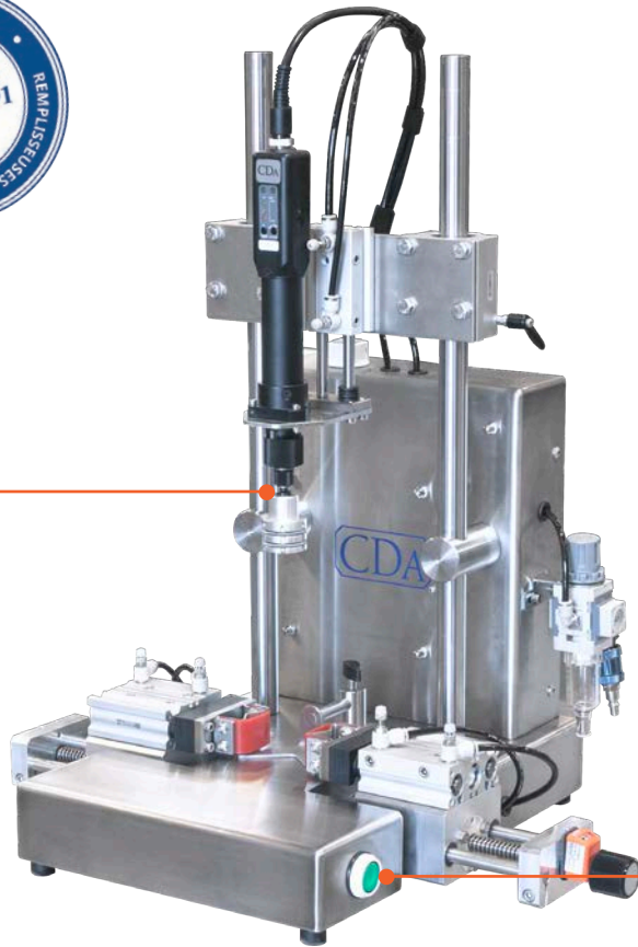
1 visseuse intégrée